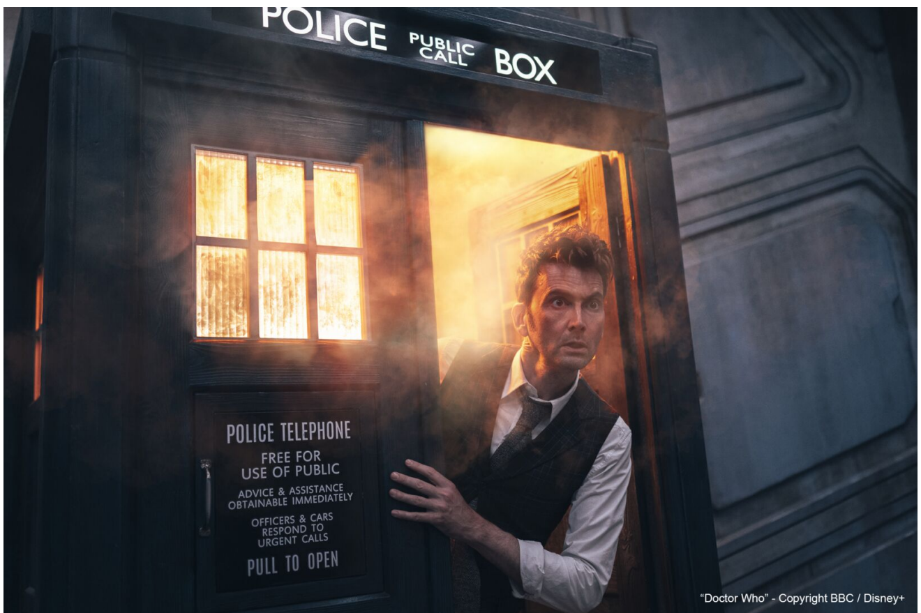
"Doctor Who"